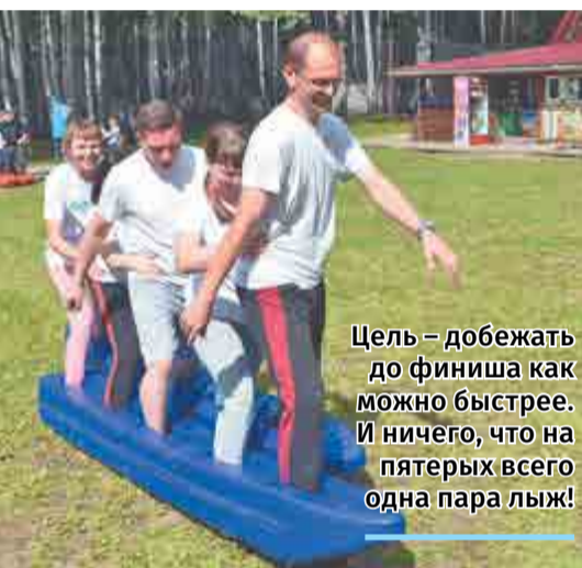
Цель – добежать до финиша как можно быстрее. И ничего, что на пятерых всего одна пара лыж!