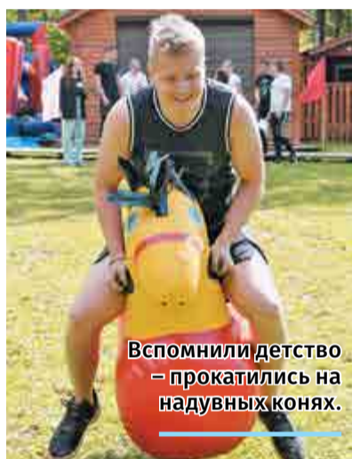
Вспомнили детство – прокатились на надувных конях.