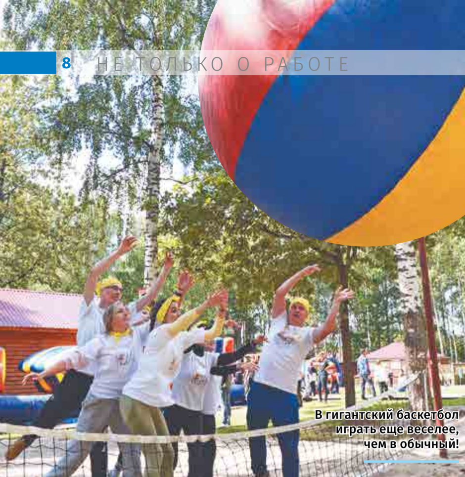
В гигантский баскетбол играть еще веселее, чем в обычный!

– Понравилась идея провести активно и спортивно воскресенье, и мы быстро собрали команду. Это было действительно интересно и весело. Настроение супер! В нашем БТК работают одни девчонки, несколько человек позвали из цеха, отсюда и название – «Девчата».