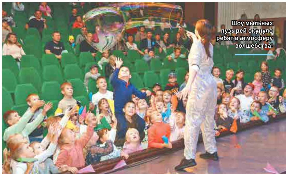
Шоу мыльных пузырей окунуло ребят в атмосферу волшебства!