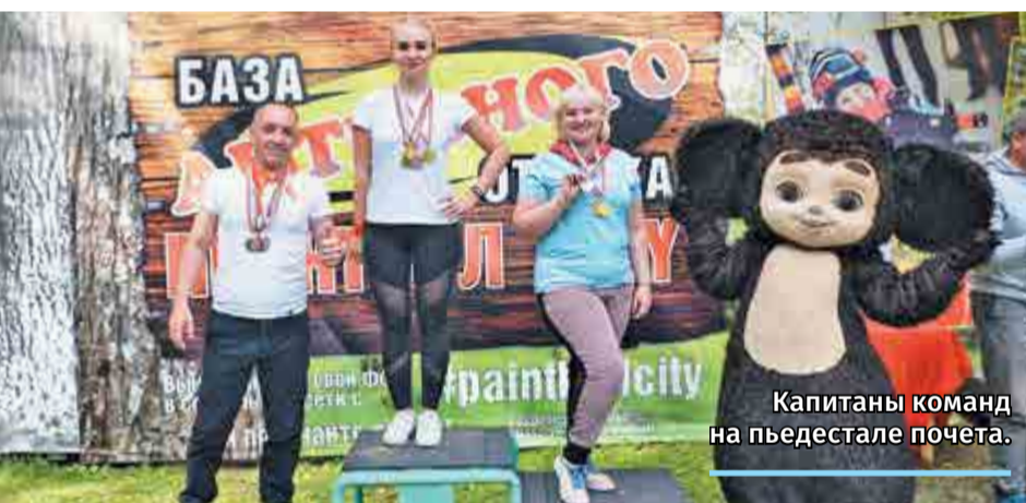
Капитаны команд на пьедестале почета.