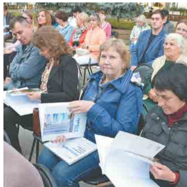
Каждый участник мероприятия, получив сборник, спешил сразу же пролистать яркие страницы.